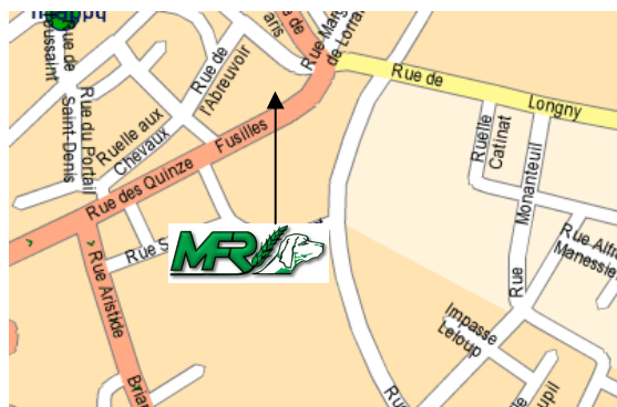
Emplacement de la MFR