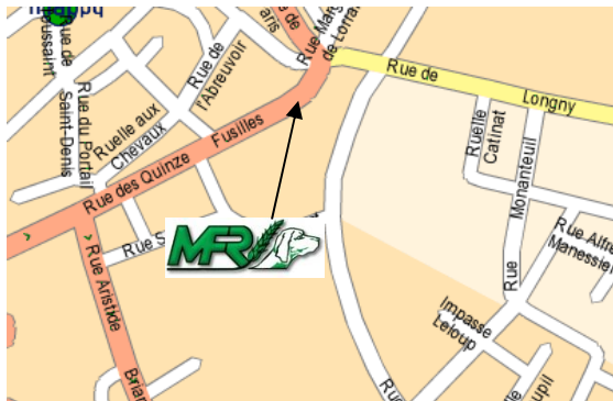
Emplacement de la MFR